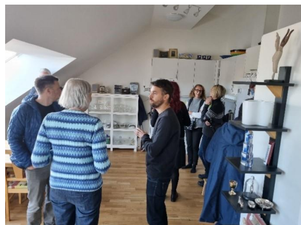
Intressant och trevligt besök, med guidning, på kollektivboendet Under samma tak. T.v. orangeriet är en favorit bland de boende, med fin utsikt över omgivningarna. T.h. interiör från en av lägenheterna, med intresserade och nyfikna besökare.