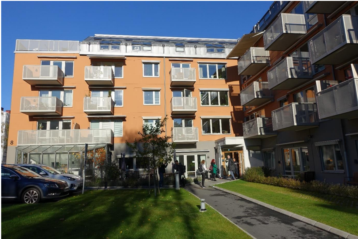
Under samma tak, i Göteborg.