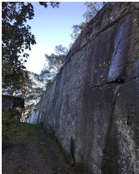
Den branta klippväggen, som döljer ett par byggnader, placerade ovanför.