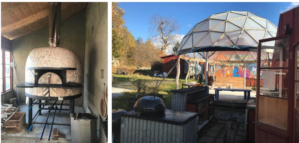
Orangeriet, interiört med den omtalade pizzaugnen och exteriört, med en liten scen under en speciell kupol.

Studiebesöksdelen avslutades med en gemensam sopplunch med nybakat bröd, innan fyra personer var tvungna att avvika för att hinna med tåg. Eftermiddagen bestod sedan av en workshop. Syftet med den var att diskutera vad vi, olika aktörer, ser för utmaningar avseende att få till gemensamt byggande och bogenenskaper i större skala i Sverige samt vad vi kan ha för roll i det arbetet. Vi var ganska överens om att det bör göras mer men att det finns stora utmaningar kring exempelvis finansiering av den här typen av boenden och ett ganska skeptiskt förhållningssätt från såväl kommuner som byggbolag, då det skiljer sig från det "normala". Här finns mycket att göra – men en början är i alla fall att sprida de exempel på projekt som ändå finns.