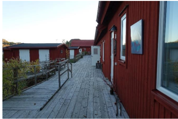
T.v. interiör från en av enrumslägenheterna – med sovplatsen på loftet. Bilden till höger visar framsidan på Hogslätts vänboende.

Direkt efter det gjordes även en genomgång av ett liknande projekt, i närheten av Hogslätts Vänboende, som heter Andreastorpets Vänboende . Det är än så länge inte byggt utan befinner sig i planeringsstadiet. Det återstår att se om men också när det kan stå färdigt. Förhoppningsvis förverkligas projektet som ett bra tillskott för orten.