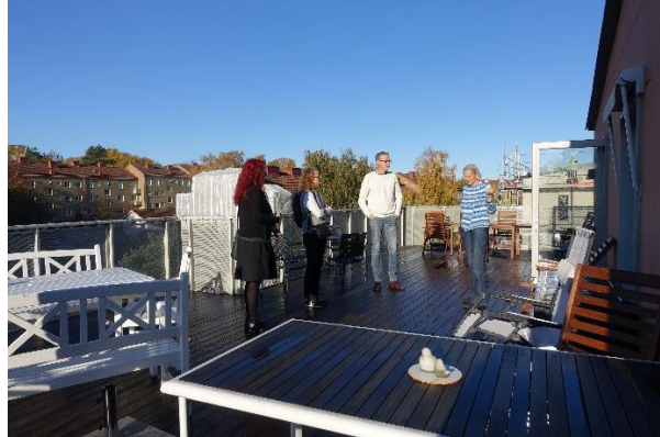
Exteriör från boendet Under samma tak. Till höger en av de två terrasserna, med den öppna dörren som leder in till ett orangeri.

Väl på plats blev vi varmt välkomnade och fick kaffe och smörgås tillsammans med en intressant föredragning om kollektivboendet, med dess många utmaningar och turer längs vägen. Från att ha mött svårigheter avseende att hitta aktörer som ville bygga den här typen av boende till invecklade mark- och parkeringsfrågor och diskussioner med kommunen, gick det till slut vägen. Trollängen, den aktör som till slut nappade och som också äger boendet, tycker att det hela blev lyckat. De boende fick under processens gång vara med och påverka en hel del avseende vad de ville att boendet skulle innehålla. De boende är också nöjda med resultatet, även om de hade vissa idéer, som de inte fick gehör för. Trivs gör de i alla fall och kollektivboendet Under samma tak har blivit något av en föregångare i Göteborg. Det borde finnas goda förutsättningar för fler liknande boenden i staden. Trollängen svarade ja på frågan som ställdes från åhörarna, avseende om de kan tänka sig att göra ett liknande projekt. Det bådår sannerligen gott!