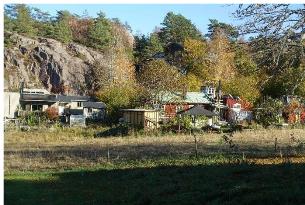
Några exempel på de speciella byggnader som finns inom området, som byggts av de boende. Källa: Göteborgs universitet, fotograf: Jenny Stenberg.