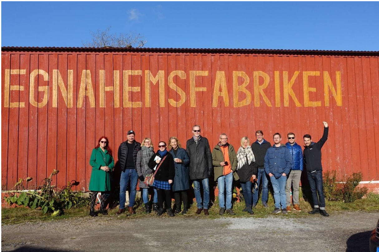
Hela gänget som deltog på resan och de inspirerande studiebesöken, fångade på bild, sånär som på fotografen Jenny Stenberg. Källa: Göteborgs universitet.

Nu är detta en rapport från ett studiebesök inom ramen för ett samverkansprojekt. Men vi vill ändå ta tillfället i akt att föreslå hur frågorna kan tas vidare inom vår organisation redan nu. Vi bedömer att det ligger allt för mycket potential i ämnet för att låta det stanna vid en rapport. Vi vill därför föreslå att vi snarast samlar en mindre grupp representanter, från verksamhetens olika verksamhetsområden, för att testa idén om en fördjupad samverkan med denna rörelse. De tre rapportförfattarna kan inom ramen för projektet arrangera en enklare workshop i ämnet för utvalda representanter i slutet av året/i början av nästa år.